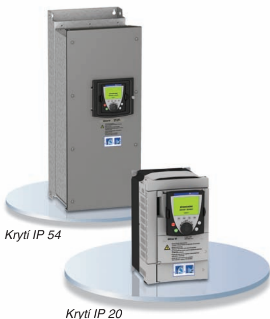
Krytí IP 54