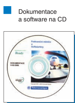
Frekvenční měniče a softstartéry