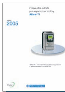
Frekvenční měniče Altivar 71