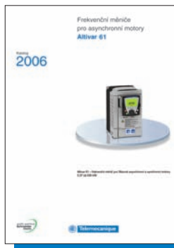
Frekvenční měniče Altivar 61